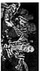
Danza Folclórica Huasteco Martes 23 / 19:00 horas