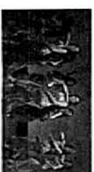
Danza Anabe Sábado 28 / 19:00 horas