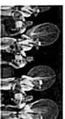
Danza Folclórica de Capilla de Cpo. Domingo 29 / 19:00 horas