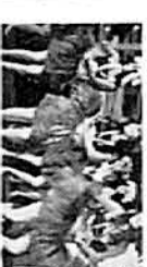
Danza Folclórica Lunes 30 / 19:00 horas