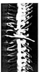
Danza Clásica Desarrollo Jueves 25 / 19:00 horas