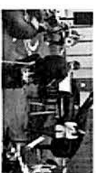
Exposición Musical Miércoles 24 / 19:00 horas