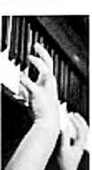
Concierto de Piano Martes 31 / 19:00 horas