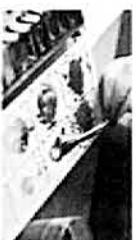
Exposición de pintura Creación Festival Martes 23 / 18:00 horas